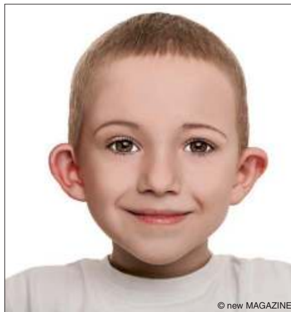
Figura 14. Esempio di orecchie ad ansa.