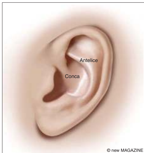
Figura 13. Scopo dell'otoplastica è ricreare la normale conformazione di conca ed antelice.