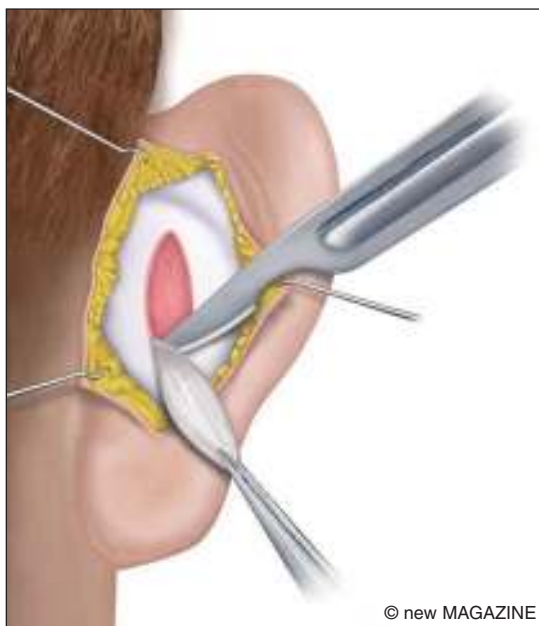
Figura 16. Resezione di una porzione della conca.